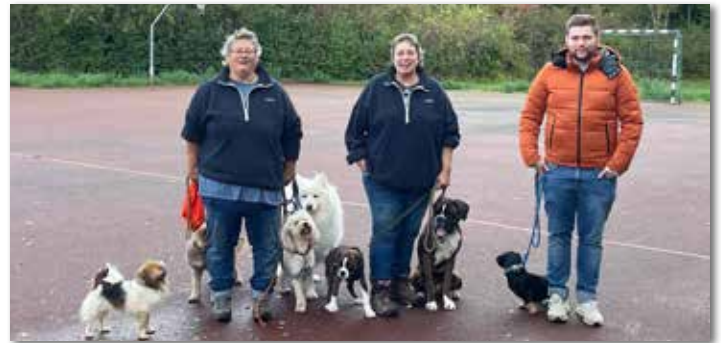
Team der Hundeschulen Frankenhöhe und Pfoten Service Franken