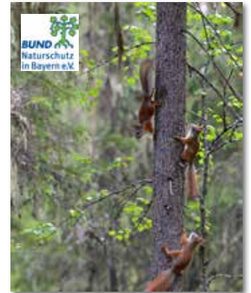
Drei Eichhörnchen

Ein weiteres spannendes Ergebnis ist die Vielfalt der Fellfarben der Eichhörn- chen. Fast alle Farbvarian- ten können in jeder Popu- lation vorkommen. Sind in höheren Lagen mit Nadel- wald die Tiere tendenziell dunkler gefärbt, kommen in laubwaldreicheren Gebieten vorwiegend rote Eichhörn- chen vor. „Hier im Landkreis wurden bisher überwiegend rote Eichhörnchen gemel- det“, erklärt Moni Nunn.